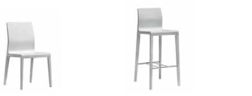
Dimensioni / Sizes